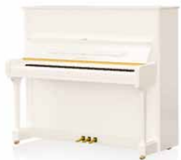
Concert 8 Ausführung Weiß poliert