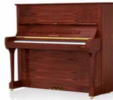
Concert 8 Ausführung Mahagoni