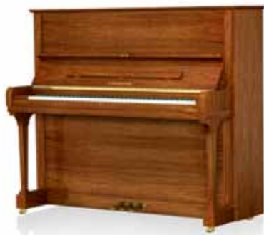
Concert 8 Ausführung Nussbaum