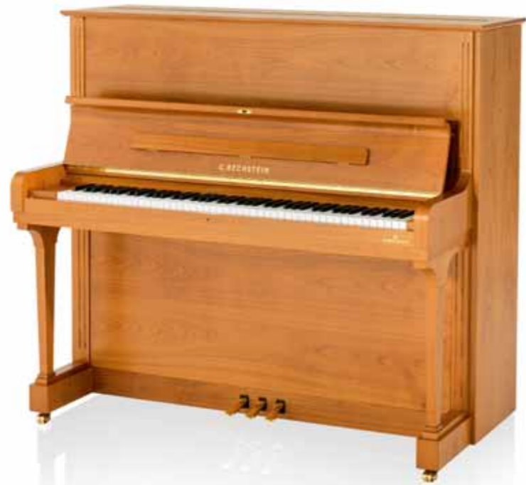
Concert 8 Ausführung Kirschbaum

Hier einige beispielhafte Furniere. Individuelle Wünsche verwirklichen wir gern. C. Bechstein ist spezialisiert auf einzigartige Sonderausführungen.